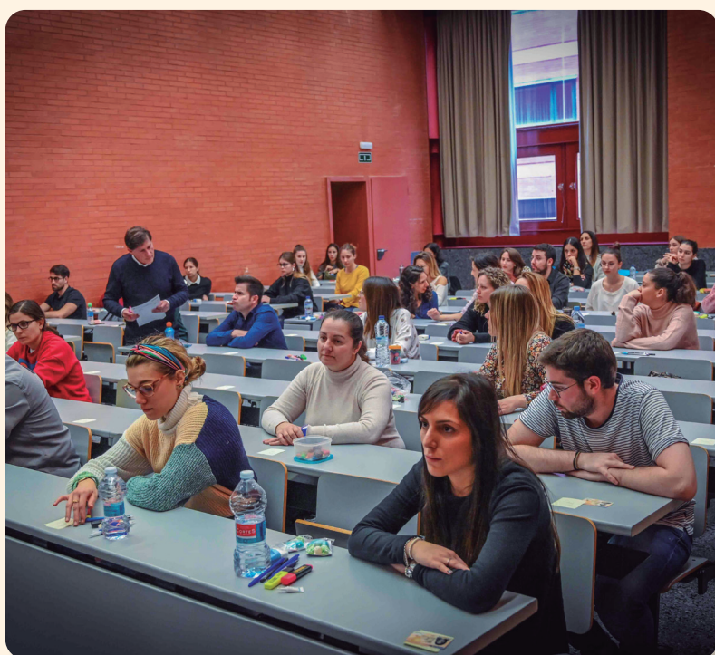
Imagen de una pasada edición del examen EIR